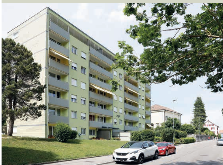
L'assainissement s'est déroulé en deux étapes, sur plusieurs années.

Rénover le bâtiment pour les seniors et personnes en situation de handicap a relevé du tour de force. Le résultat réjouit autant la fondation que la Commune, laquelle souhaite céder un terrain en droit de superficie pour réaliser un nouveau projet.