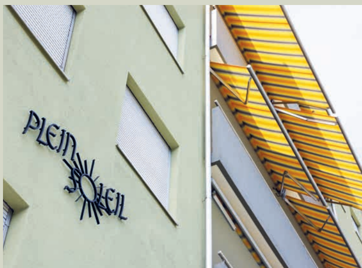
Le bâtiment a retrouvé tout son lustre.

« Il a fallu se battre pendant des années. »