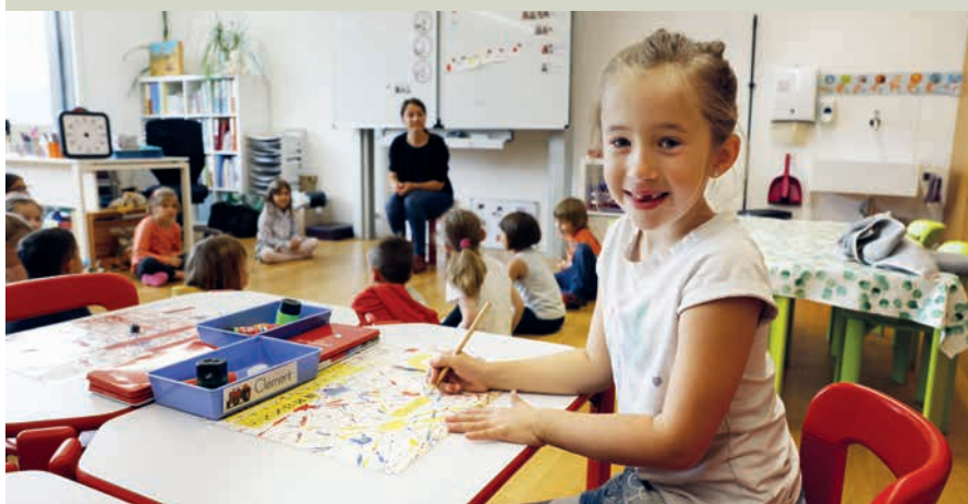
Dans la partie inférieure du bâtiment, on enseigne aux enfants ...

La commune de montagne valaisanne de Saint-Martin cumulait les difficultés : une école vétuste, trop peu de logements pour les personnes âgées et les jeunes couples, et un nombre d'habitants en baisse. La construction d'une maison intergénérationnelle en a résolu beaucoup.