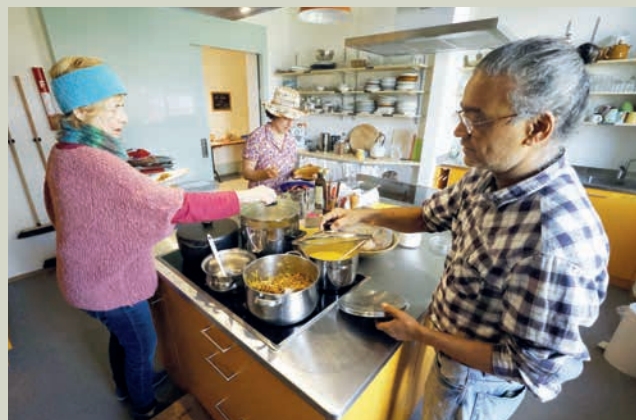
... a été préparé dans la cuisine commune.

Plus que centenaire et de style Art nouveau, l'hôtel Belmont, magnifiquement situé sur les hauts de Wilderswil, est longtemps resté inoccupé et sa démolition était programmée. Jusqu'à ce qu'en 2013, deux retraitées venues de la plaine souhaitent y matérialiser leur vision d'une nouvelle forme d'habitat : en communauté, à des prix conformes à ceux du lieu, et dans le respect de l'environnement.