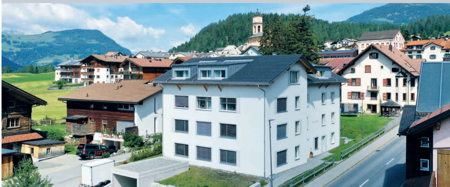
Le nouveau bâtiment construit au centre de Lantsch/Lenz s'intègre parfaitement au paysage local.

Trouver un logement abordable à proximité immédiate de Lenzerheide est chose rare. La Commune s'est attaquée au problème et a cédé des terrains en droit de superficie à une coopérative. 20 logements viendront s'ajouter aux huit premiers.