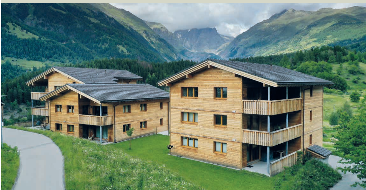
Les nouveaux bâtiments sur les hauts du cœur historique d'Ernen sont entièrement loués.

La Commune a créé une coopérative qui a construit des logements locatifs attrayants et bon marché pour de jeunes autochtones, un projet qui a failli échouer faute de soutien des banques et des caisses de pension.