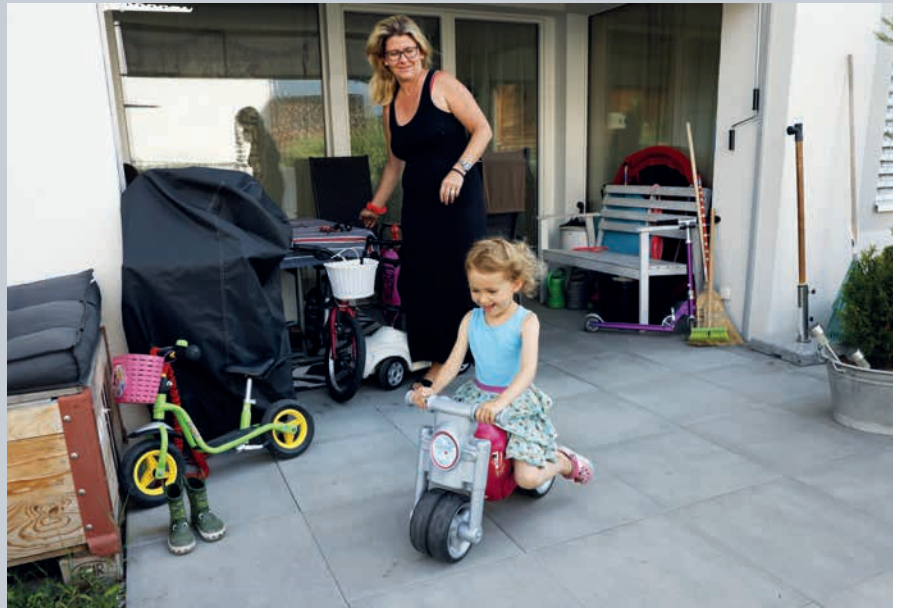
Au rez-de-chaussée, les familles peuvent profiter de la terrasse.