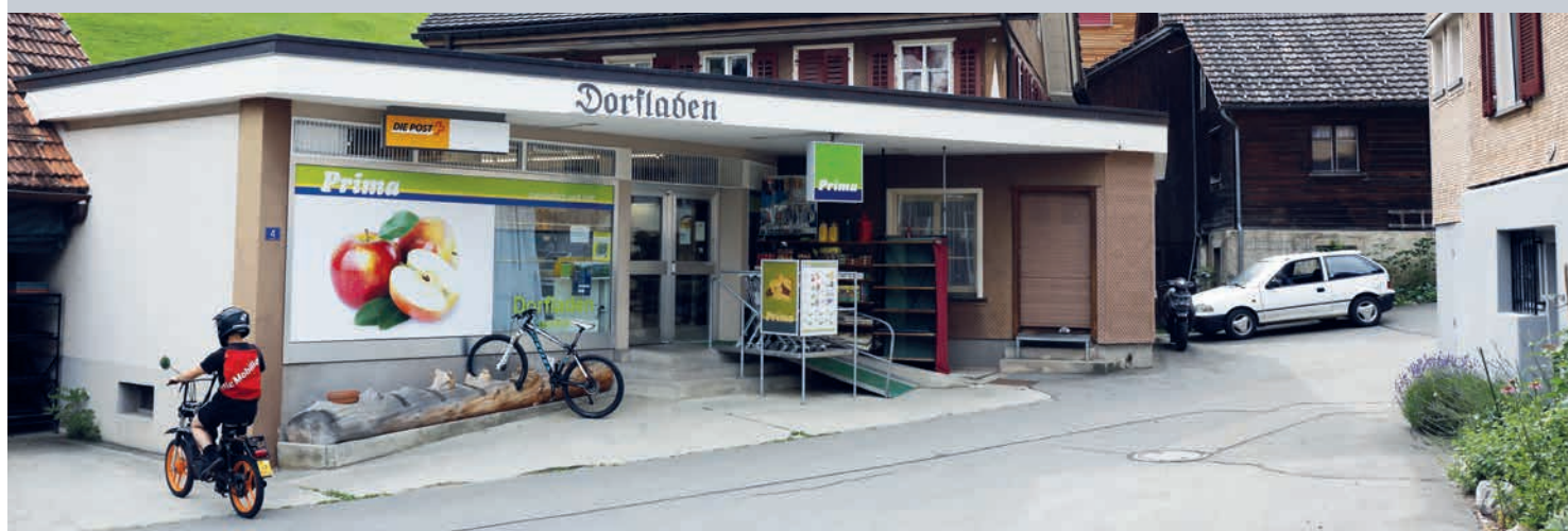
Des logements locatifs ont vu le jour au-dessus du magasin du village.

Au début, l'idée était de sauver le magasin du village. Mais la commune de montagne du canton d'Uri, qui dispose de peu de moyens, a aussi réussi, pas à pas, à gagner en attractivité pour les jeunes. Construire des logements pour personnes âgées pourrait être la prochaine (grande) étape.