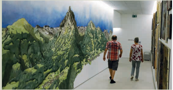
Un couloir souterrain relie l'immeuble d'habitation au magasin et au restaurant.