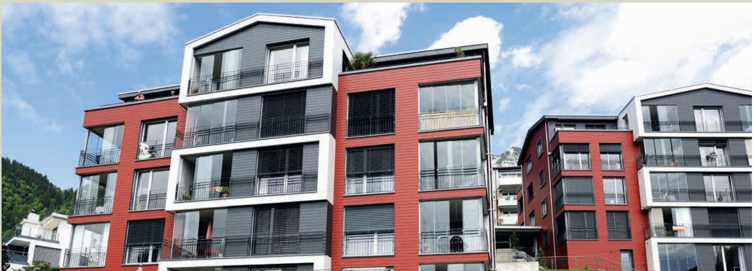
Les bâtiments abritant les 26 logements sans obstacles sont situés au cœur du village.