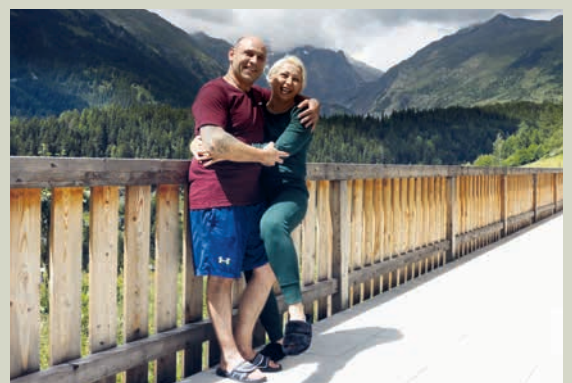
La grande terrasse offre de l'espace supplémentaire aux occupants.

Le modèle coopératif a fait ses preuves : grâce à lui, la spéculation n'a pas de prise sur ces logements.