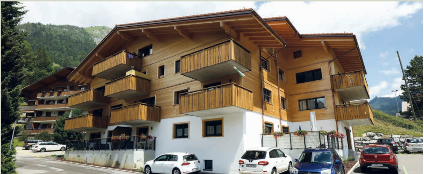
Le projet a failli capoter plusieurs fois, mais l'engagement a finalement payé.