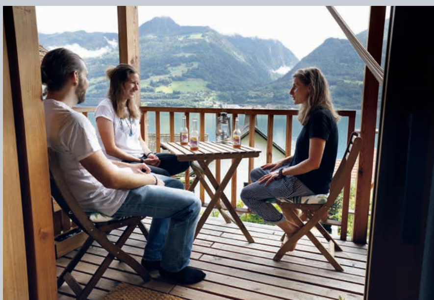
L'appartement inférieur offre lui aussi une vue sur la «Riviera de la Suisse orientale».