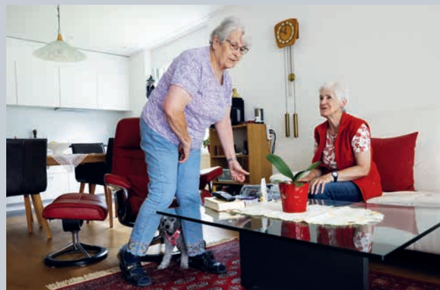
On se rend mutuellement visite.

En fait, les jeunes souhaitent rester au village. Mais les terrains constructibles étant trop chers, ils s'en vont : ce problème est connu de nombreuses communes de montagne. Wolfenschiessen a très tôt décidé de saisir le problème à bras-le-corps. En 1990, la Commune de Nidwald a créé la fondation «Wohnen und Arbeiten in Wolfenschiessen» (vivre et travailler à Wolfenschiessen). Son objectif : proposer des logements et des locaux commerciaux à des prix avantageux.