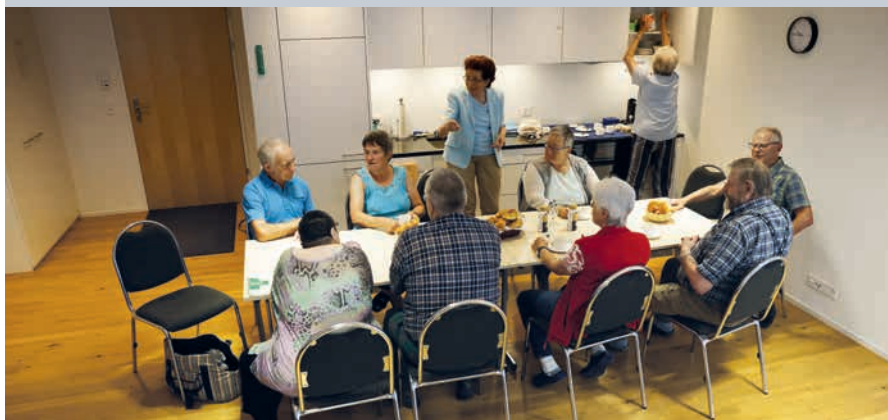
On se retrouve dans la salle commune autour d'un café-croissant.

Pour lutter contre l'exode de ses habitants, la Commune a créé une fondation qui a construit une maison pour personnes âgées. Celles-ci pouvant maintenant habiter au centre du village, elles libèrent des logements pour les familles.