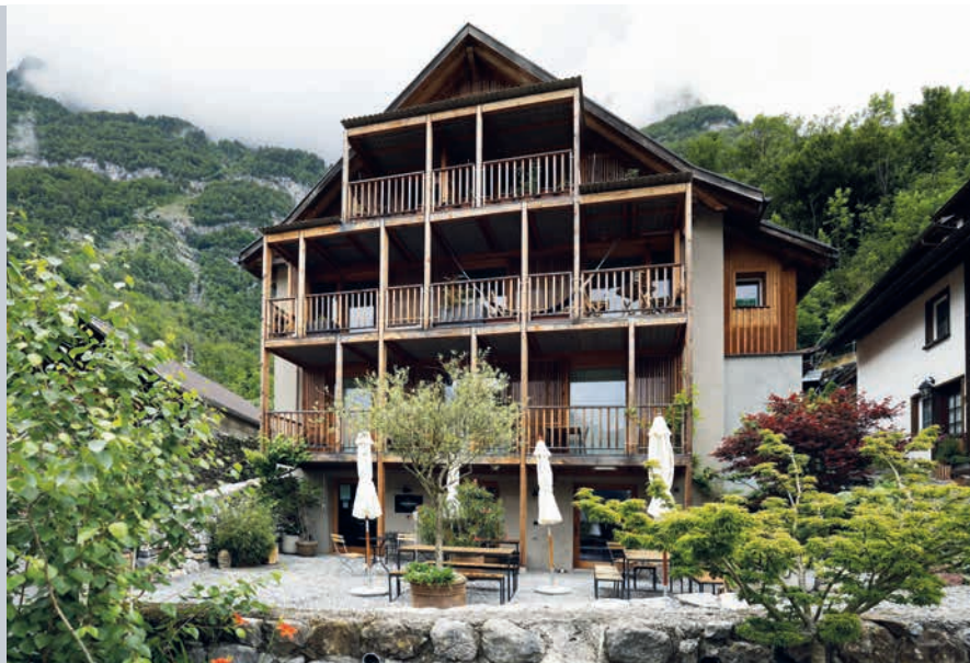
L'ancien bâtiment en ruine accueille des logements et des activités commerciales.