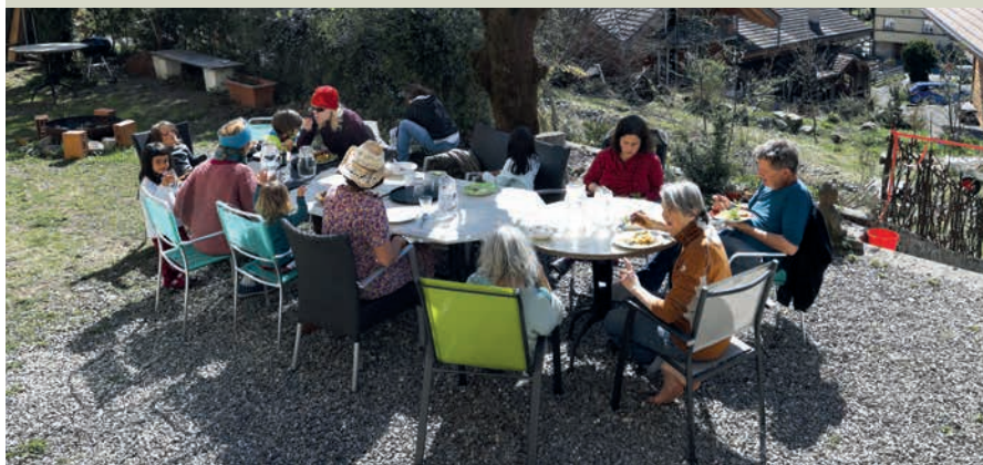
Le repas pris sur la terrasse dominant Wilderswil ...

Des célibataires et des couples de tous âges ont emménagé dans un ancien hôtel de style Art nouveau pour y vivre en communauté. La Commune a limité la bureaucratie et a vu ses efforts récompensés par le retour de personnes qui l'avaient quittée.